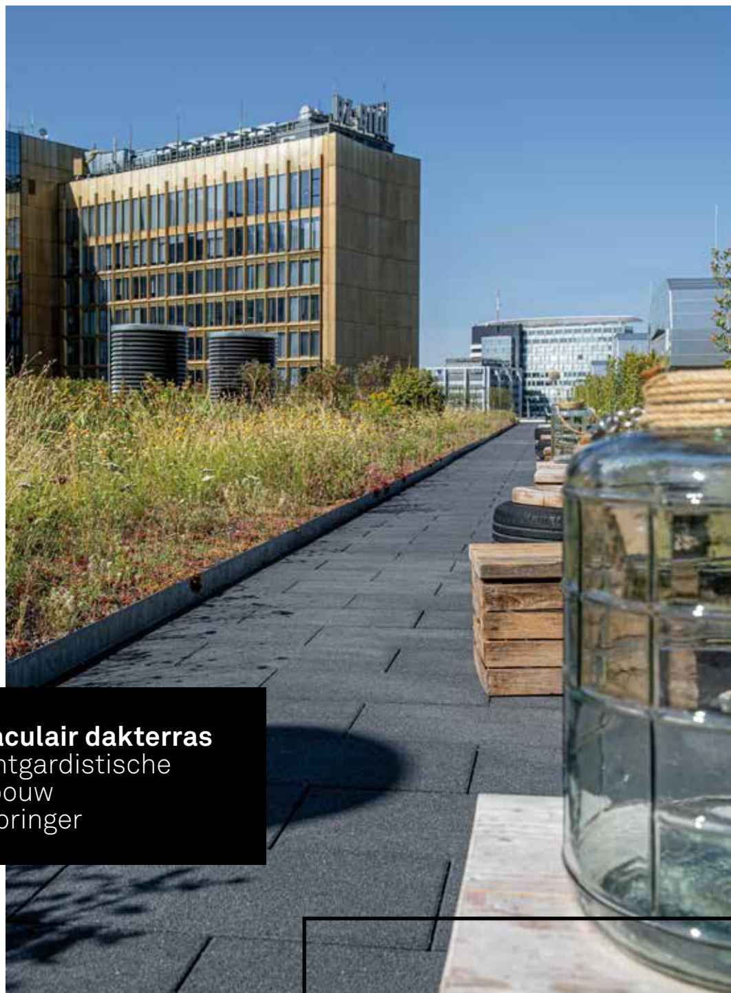
Spectaculair dakterras bij avantgardistische nieuwbouw Axel-Springer

Grootstedelijke oase boven de daken van Berlijn