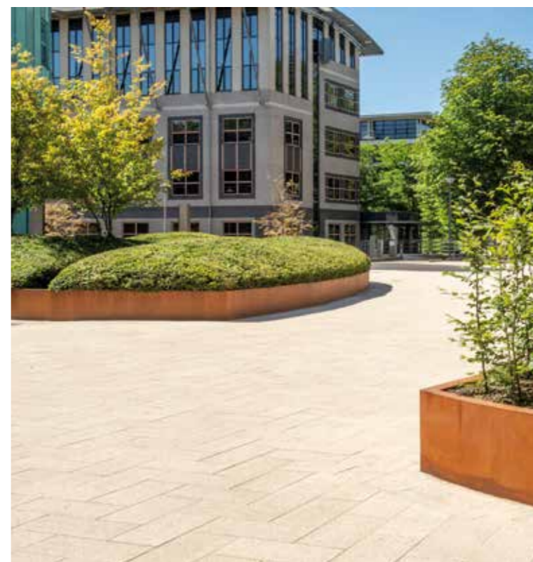
Buitenruimte veranderd in representatieve en goed gebruikte verblijfsruimte.