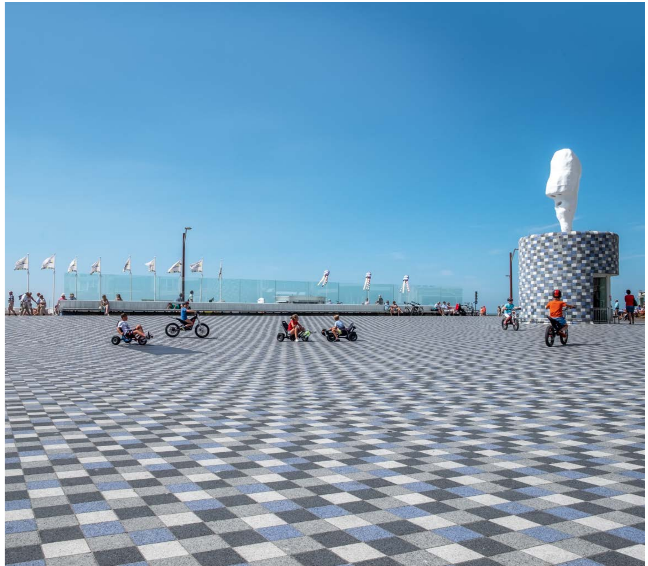
De toegang tot de parkeergarage via twee paviljoentjes opgetrokken in hetzelfde Boulevard materiaal.

Het iets holle vloerdek is bekleed met stenen in grijs, wit en blauw, die verwijzen naar de Noordzee net als het patroon waarin zij zijn gelegd. We hebben gekozen voor een sierbestrating met betonklinkers van Metten vanwege de slijtvastheid en omdat de kleuren die zij op ons verzoek voorstelden, perfect aansloten bij de kleuren die wij voor ons zagen. Zij waren daarnaast verantwoordelijk voor de banden aan de zeezijde van het plein in materiaal en kleur die passen bij de bestrating. Deze houden het plein vrij van strandzand. De bekleding van de twee paviljoens op het plein is van hetzelfde materiaal als van de bestrating. De paviljoens geven toegang tot de parkeergarage. Al het materiaal is op de maat van ons ontwerp voor het plein gemaakt en ondersteunt onze visie. Op de paviljoens plaatsten we beelden van Franz West, twee grote koppen, zo'n vijf meter hoog. West noemt ze Lemurenhoofden, naar geesten uit de Romeinse oudheid. Ze zijn uitgevoerd in duurzame kunststof.